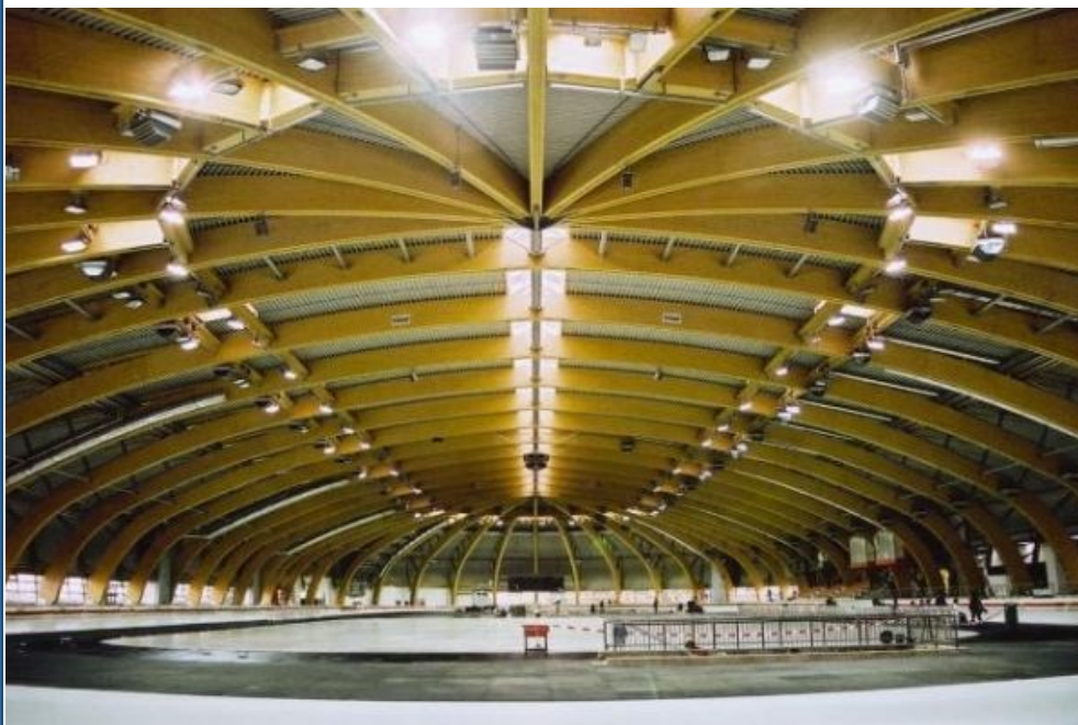
Foto: ijsbaan in Erfurt

In verband met de voorbereidingen van het komende wedstrijdseizoen gaat de baanselectie in de herfstvakantie op trainingskamp naar Duitsland. Daar zullen ze een week optimaal kunnen trainen en deze week wordt afgesloten met een schaatswedstrijd op verschillende afstanden.