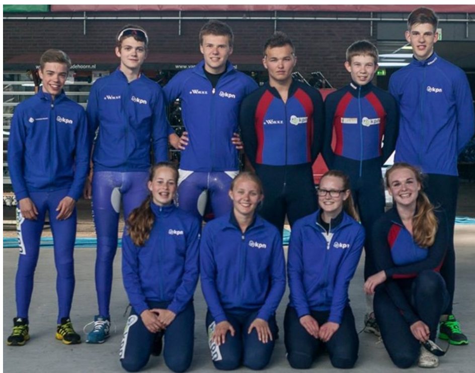
De schaats(t)ers van de Baanselectie 2014/2015.