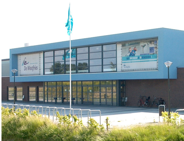
Ijsbaan "De Westfries" in Hoorn.

De eerste wedstrijd van het seizoen is op zondag 12 oktober om 17.30 uur op ijsbaan "De Westfries" in Hoorn. U bent van harte welkom. Vrij entree.